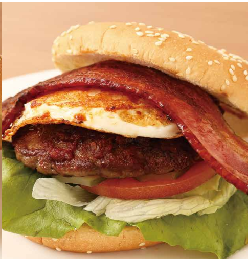
ベーコンエッグバーガー