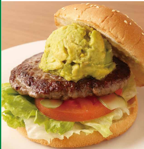
森のバターバーガー(アボガド)